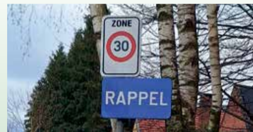
Eéntalige Franse borden verwijderd

kunnen een beroep doen op subsidies van de Vlaamse regering om de deelname van personen in armoede aan vrijetijdsinitiatieven, -activiteiten en -verenigingen binnen en buiten de gemeente te financieren en initiatieven van of voor personen in armoede op sportief, of cultureel vlak te ondersteunen en te financieren. Voor 2024 werden slechts enkele nieuwe aanvragen ingediend. Uit het antwoord van minister-president Jan Jambon (N-VA) op vraag van Vlaams parlementslid Brecht Warnez (CD&V) leren we dat het intergemeentelijk samenwerkingsverband (IGS) Noordrand in 2024 kan rekenen op 36.333 euro subsidie (Vlaamse trekkingrechten genaamd). IGS Noordrand is een projectvereniging, die uit de gemeenten Grimbergen, Kampenkout, Kapelle-opden-Bos, Londerzeel, Machelen, Meise, Merchtem, Opwijk, Steenokkerzeel, Vilvoorde en tenslotte Wemmel bestaat.