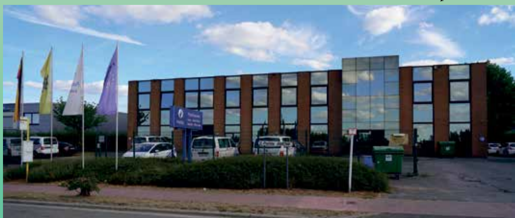
Geen fietsbrigade meer in zone AMOW

Om meer blauw op straat te krijgen en inbraak te ontraden, verwacht de Wemmelse burgervader meer heil van de nieuwe politiewerking in de op stapel staande grotere fusiezone. Hierdoor zou het aantal patrouilles van 3 naar 8 kunnen stijgen.