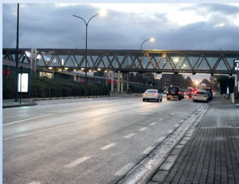
Romeinse Steenweg: komt er een tunnel?

In Wommel worden de dossiers Neo-project en de herinrichting van de Ring met argusogen gevolgd. Voor de ontsluiting van het Neo-project op de Heizel naar de Ring rekende Brussel op een verbindingsweg via een tunnel onder de Romeinse Steenweg. Tot nog toe weigerde Vlaanderen steeds een vergunning hiervoor. Net omwille van de mobiliteitsproblematiek verwierp de Raad Van State tot driemaal toe de Brusselse plannen.