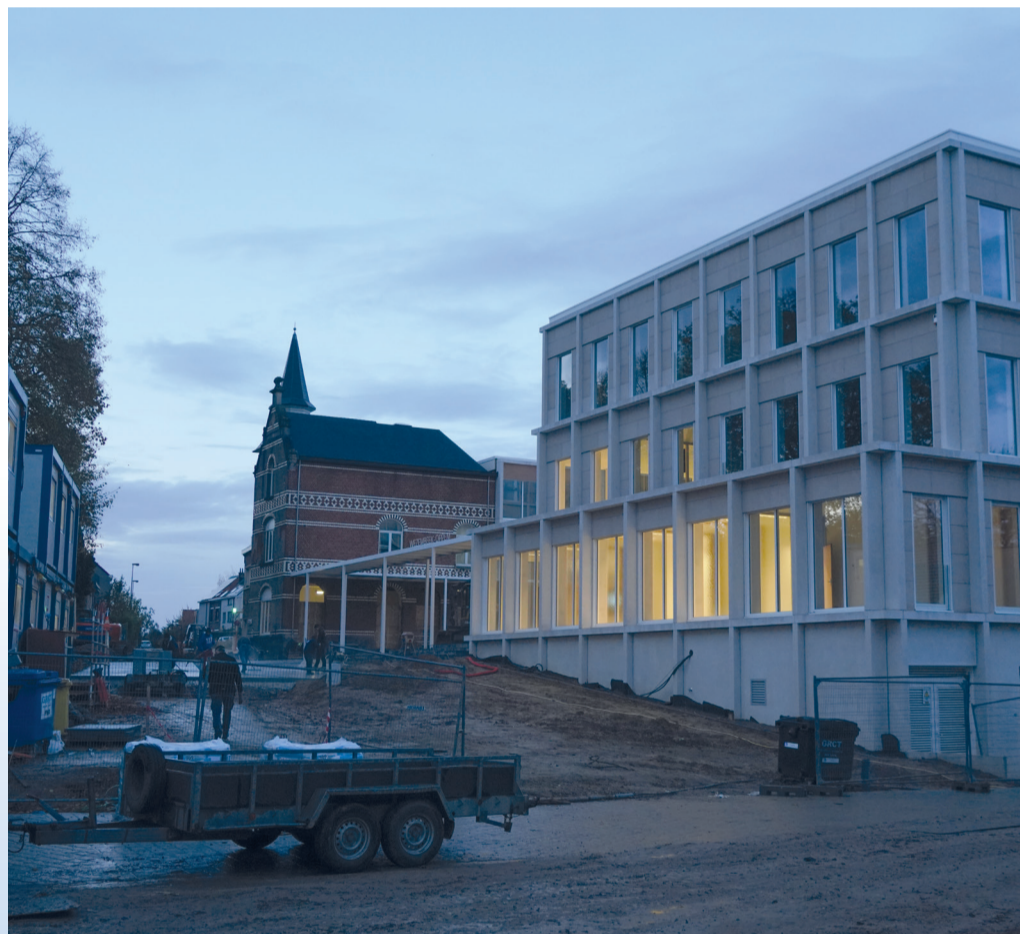
Het nieuwe gemeentehuis van Wezembeek-Oppem. Nog volop in afwerking zodat de diensten op 23 november kunnen verhuizen. De meerderheid heeft deze mastodont de Engelse naam 'City Hall' gegeven. Volgens de burgemeester 'omdat het zoveel meer is als een gemeentehuis.' van Dale woordenboek vertaalt het naar 'gemeentehuis'...

Tegen die vernietiging door Homans gingen de drie gemeentebesturen in beroep, net als tegen vernietigingsbeslissingen