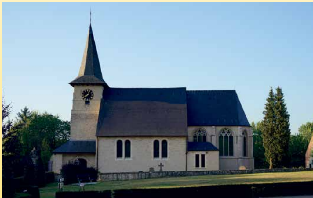
Sint-Pancratiuskerk - Kraainem

Zestig jaar later staan wij voor de zoveelste keer voor een communautaire impasse zonder weerga. Een nooit geziene economische aderlating staat ons te wachten. Daagt er aan de horizon een virusloos Vlaams moederland?