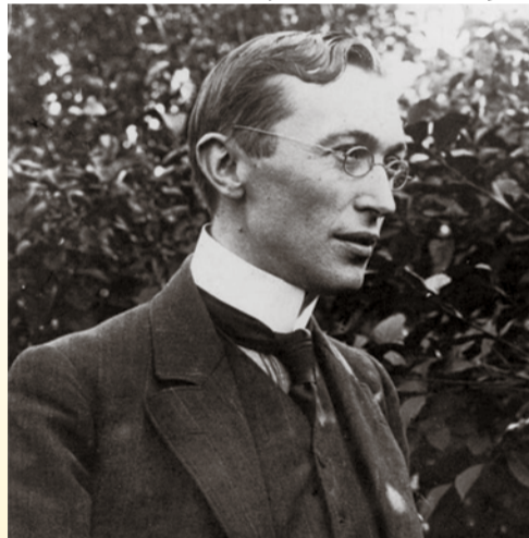
Hermen Teirlinck (foto uit 1905)

In het jongste nummer van Sjoenke, de Vlaamse gemeenschapskrant, bracht Wim Troch een uitgebreid artikel over schrijver Herman Teirlinck in Linkebeek en Beersel. In beide gemeenten liet hij een fraaie villa bouwen, die hijzelf had ontworpen