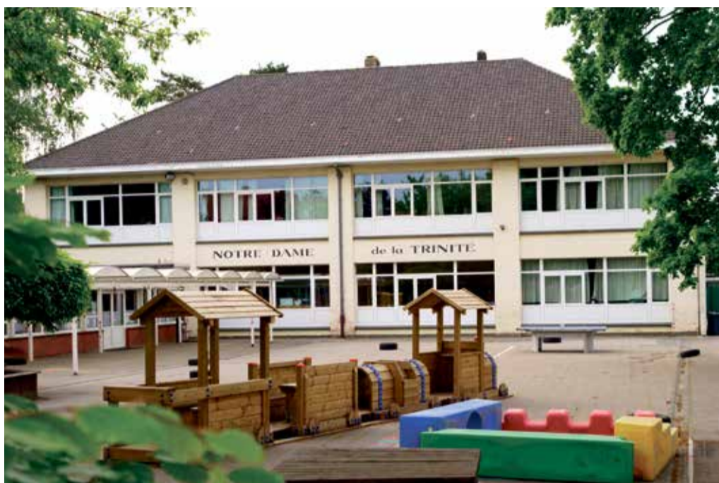
Franstalige school 'Notre Dame de la Trinité' in Wezembeek-Oppem