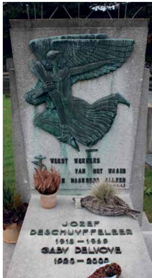
Graf Deschuyffeleer definitief beschermd

stelde om het graf van Jef Deschuyffeleer te beschermen wegens zijn hoge erfgoedwaarde. Deze bekende Wemmelaar was senator en zelfs eerste voorzitter van de Vlaamse vleugel van de Christelijke Volkspartij in 1950. Hij was ook een nauwe medewerker van de latere kardinaal Cardijn en sterk betrokken bij de uitbouw van de Katholieke Arbeiders Jeugd (KAJ). Gezondheidsproblemen ten gevolge van een