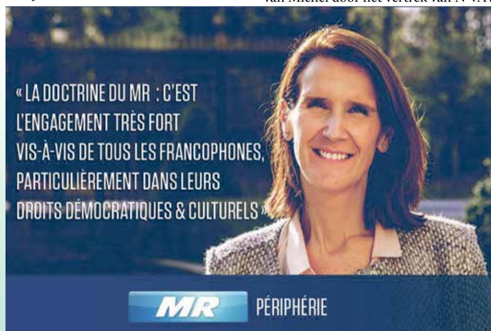
De verkiezingslogan van Wilmès

Nog een jaartje later zijn er parlementsverkiezingen, waarbij HVR eerste opvolger op de Brusselse CD&V-lijst staat, waarop de overtalrijke CD&V-kiezers uit het kanton Edingen, Komen, Moeskroen en Vloesberg ook op die Brusselse CD&V-lijst mogen stemmen. Als opvolger van minister Geens voor Justitie, komt HVR dan in de Kamer van Volksvertegenwoor-