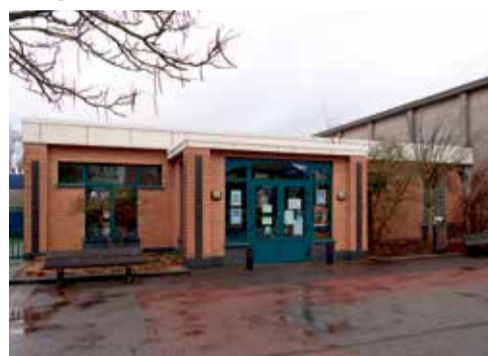
5 miljoen voor uitbreiding De Klimboom

Het meerjarenplan van het gemeentebestuur voor de volgende vijf jaar is er eindelijk doorgeraakt. Na een enquête bij de bevolking, zo lezen we in de Vlaamse Gemeenschapskrant De Lijsterbes, blijkt dat de Kraainemnaars wakker liggen van de staat van wegen, voet- en fietspaden. Daar wordt de volgende jaren 8,1 miljoen euro geïnvesteerd. Voor de uitbreiding van de Nederlandstalige basisschool De Klimboom is 5 miljoen voorzien. De francofiële oppositie vindt de stijging van de gemeenteschuld van 8 naar 12 miljoen te hoog.