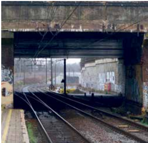
Spoorlijn 124 nog steeds op 2 sporen