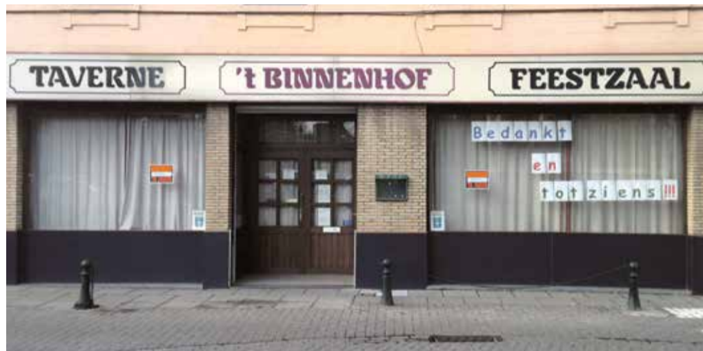
't Binnenhof, voorlaatste café waar het licht uitging

Lizette en Henri Weemaels van 't Binnenhof, vlak bij de hoofdkerk van Rode, hielden er mee op. 31 jaar dorstigen laven en hongerigen de mond met snacks volstoppen, daarvoor moet je tegen weinig nachtrust kunnen en graag een gesprekje met de klanten aangaan die over de vloer komen. Het hele gebouw werd aan een