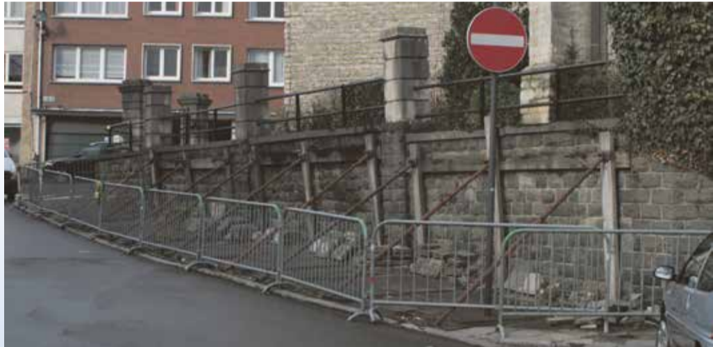
Reeds 10 jaar wordt de kerkmuur van de Sint-Servaaskerk gestut

De maand augustus vormt een negatieve uitschieter en dan pieken ook de politieinterventies.