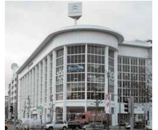
Citroëngarage aan Scaintelletteplein

nieuwe staatshervorming, met plannen rondliep om het Brussels Gewest elders een museum aan te bieden met het overhevelen van een bijeengesprokkeld federaal kunstpatrimonium naar een pronkerige gewestelijke locatie. Allicht is ook de PS-partijgenoot, Rudi Vervoort, in de combine betrokken om op kosten van de Belgische federatie het Brussels gewest en stad Brussel museaal in de verf te zetten. Miljoenen investeren in de indrukwekkende van honderden glazen ramen voorziene Citroëngarage aan het Scaintelletteplein om daar dat museum met dan nog ontvreemde kunstwerken in te planten is een al even gek idee als de planten